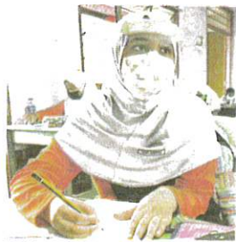
Pelajar sekolah digalakkan pakai pelindung muka. (Foto hiasan)