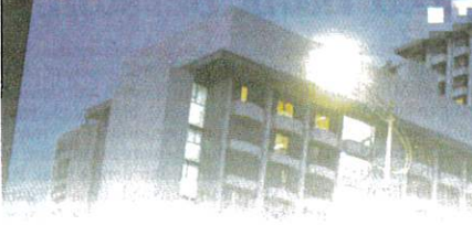
CAJ penginapan bagi tujuan kuarantin di 58 hotel terpilih kekal RM150.

Kuala Lumpur: Kerajaan bersetuju menurunkan caj penginapan di Institut Latihan Awam (ILA) bagi mengurangkan beban rakyat yang perlu menjalani kuarantin wajib 14 hari sebaik tiba dari luar negara.