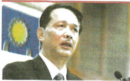
Health director- general Datuk Dr Noor Hisham Abdullah