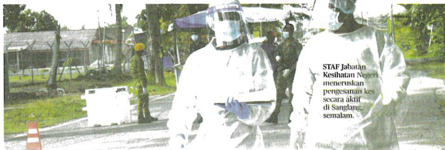
STAF Jabatan Kesihatan Negeri meneruskan pengesanan kes secara aktif di Sanglang, semalam.

Menurutnya, tiada kematian berkaitan jangkitan Covid-19 dilaporkan semalam menjadikan jumlah kumulatif kes kematian adalah 125 kes iaitu 1.37 peratus daripada jumlah keseluruhan kes.