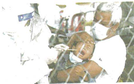
SEORANG kanak-kanak menangis ketika menjalani ujian saringan Covid-19 di Klinik Kesihatan Naphoh, Jitra.

Ibu bapa bimbang anak dijangkiti koronavirus