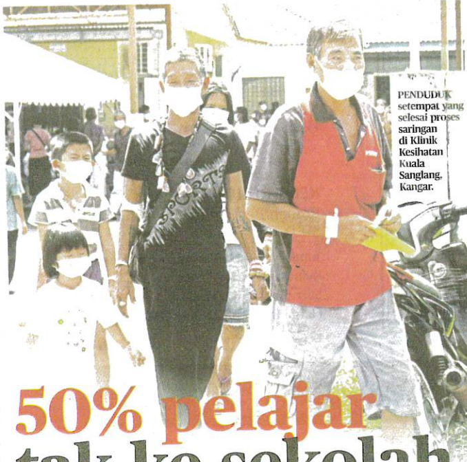
PENDUDUK setempat yang selesai proses saringan di Klinik Kesihatan Kuala Sanglang, Kangar.

Katanya, data ketidakhadiran ke sekolah ini diperoleh hasil perjumpaan dengan guru besar, pengetua dan Jabatan Pendidikan Negeri (JPN). "Ibu bapa boleh mengambil keputusan untuk tidak menghantar anak ke sekolah, tetapi perlu mendapatkan sebarang bentuk pengajaran dan pembelajaran daripada sekolah supaya anak mereka tidak ketinggalan. "Antara sekolah yang berhampiran dengan kawasan Temco ialah dalam kawasan Dewan Undangan Negeri (Dun) Simpang Empat, Dun Guar Sanji dan yang berhampiran dalam Parlimen